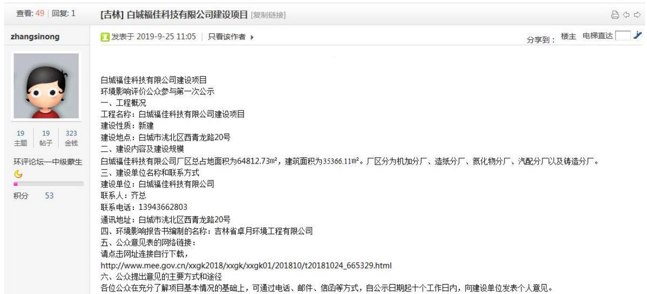
图 1 第一次公示截图