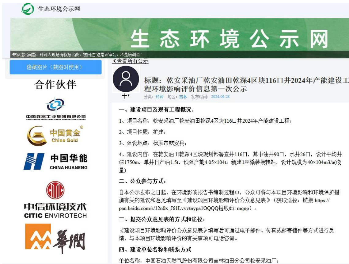
图 2-1 首次网上公示截图