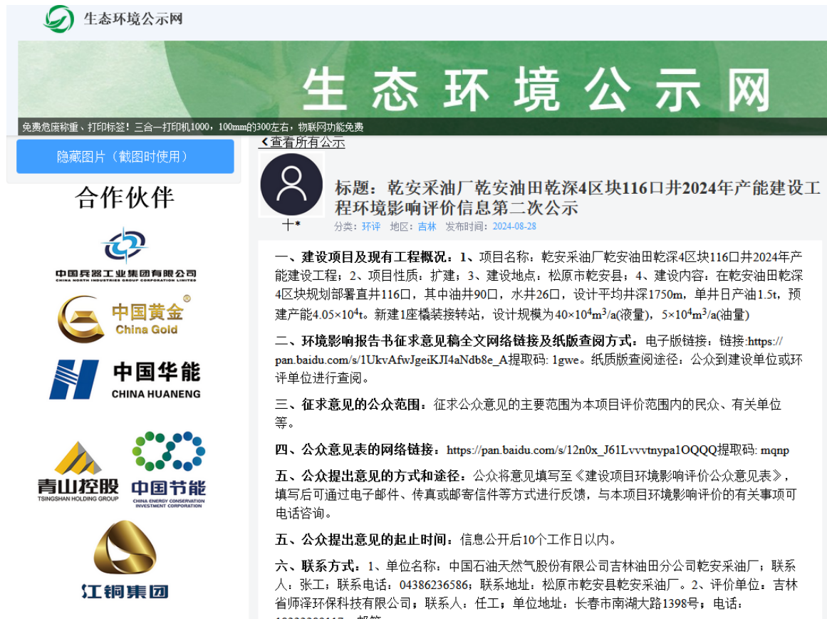
图 2-2 第二次网站公示截图