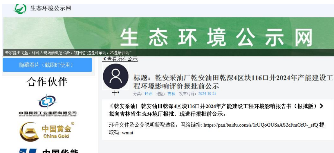
图 6-1 报批前公示截图

本项目报批前，除通过网络平台公开拟报批的环境影响评价报告书全文及公众参与说明外，未选择其他公示途径。