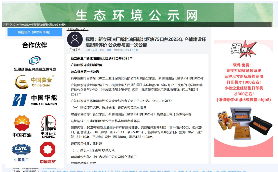
图 1 一次公示截图