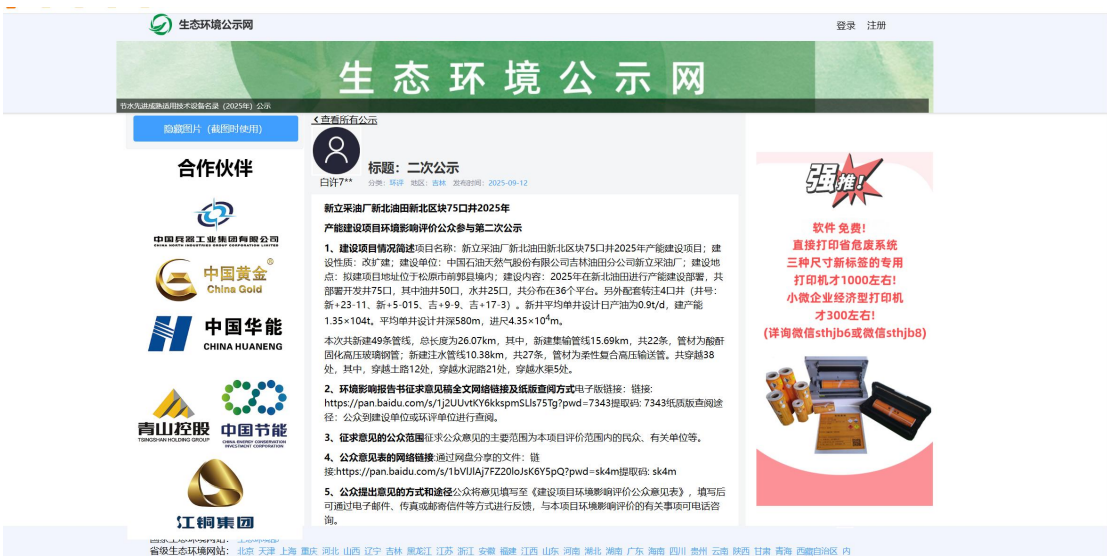
图 2 网页截图

本项目网络公示期间，根据《环境影响评价公众参与办法》第十一条中通过建设项所在地公众易于接触的报纸公开，且在征求意见的 10 个工作日内公开信息不得少于 2 次的要求。《城市晚报》投放量大、覆盖面广、涵盖人群多，是当地易于接触的报纸。为提高本项目环境影响评价公众参与的广泛性、便利性、真实性，我公司选取《城市晚报》进行环评信息公示，载体选取符合相关要求。