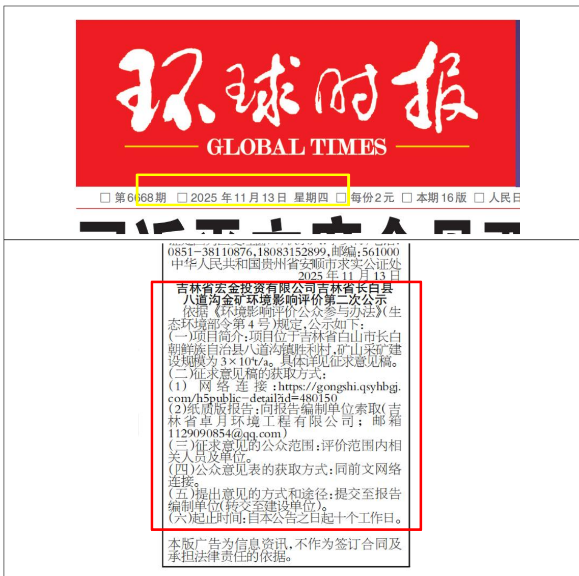
图3.2-2 报纸第一次公开信息