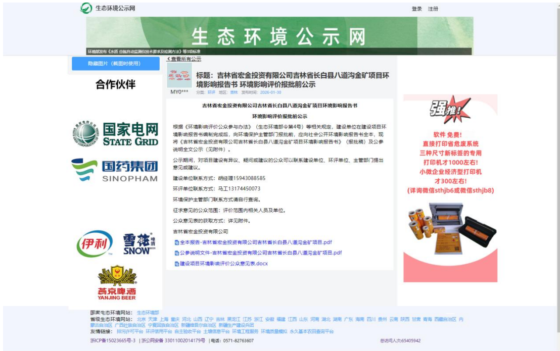
图 6.2-1 报批前公示情况