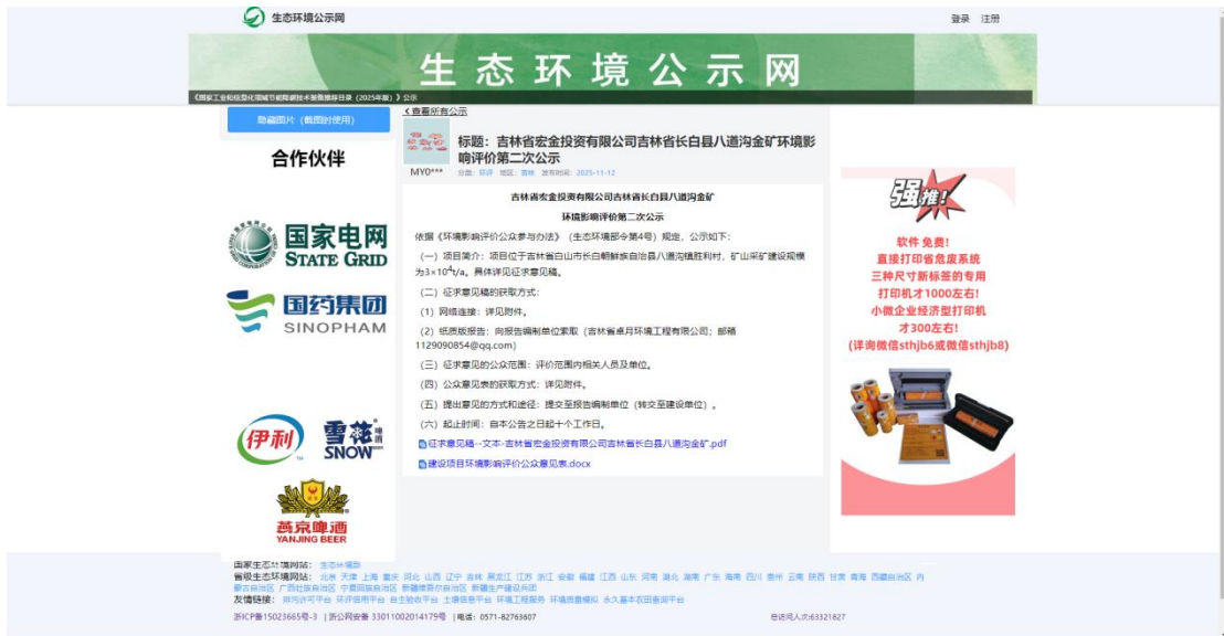
图 3.2-1 网上公示截图