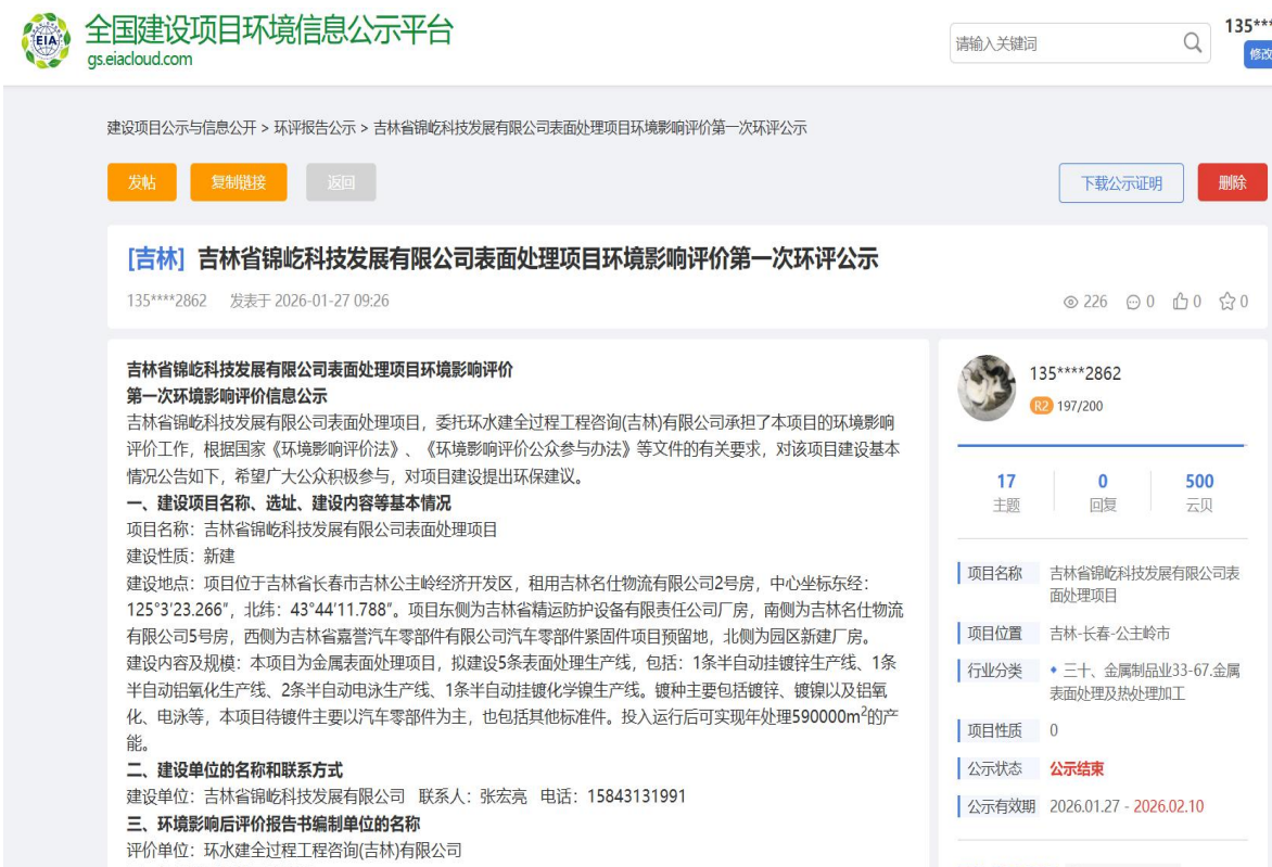
图1 第一次公示截图