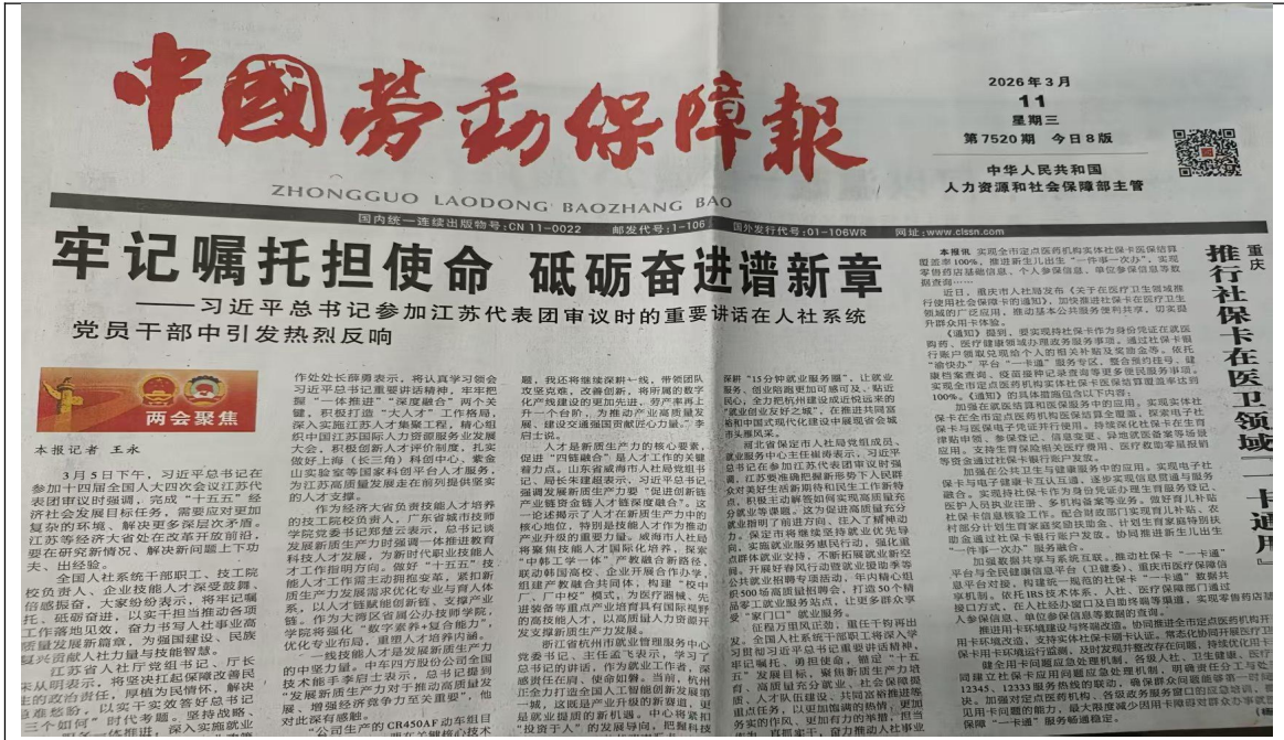
图 2-3 征求意见稿公示（二次公示）——报纸一次公示