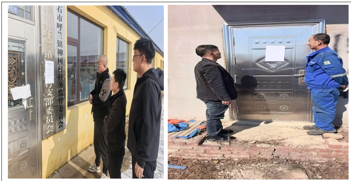
图 2-4 现场公告照片

见起止日期为 2026 年 03 月 05 日至 2026 年 03 月 18 日，共 10 个工作日。