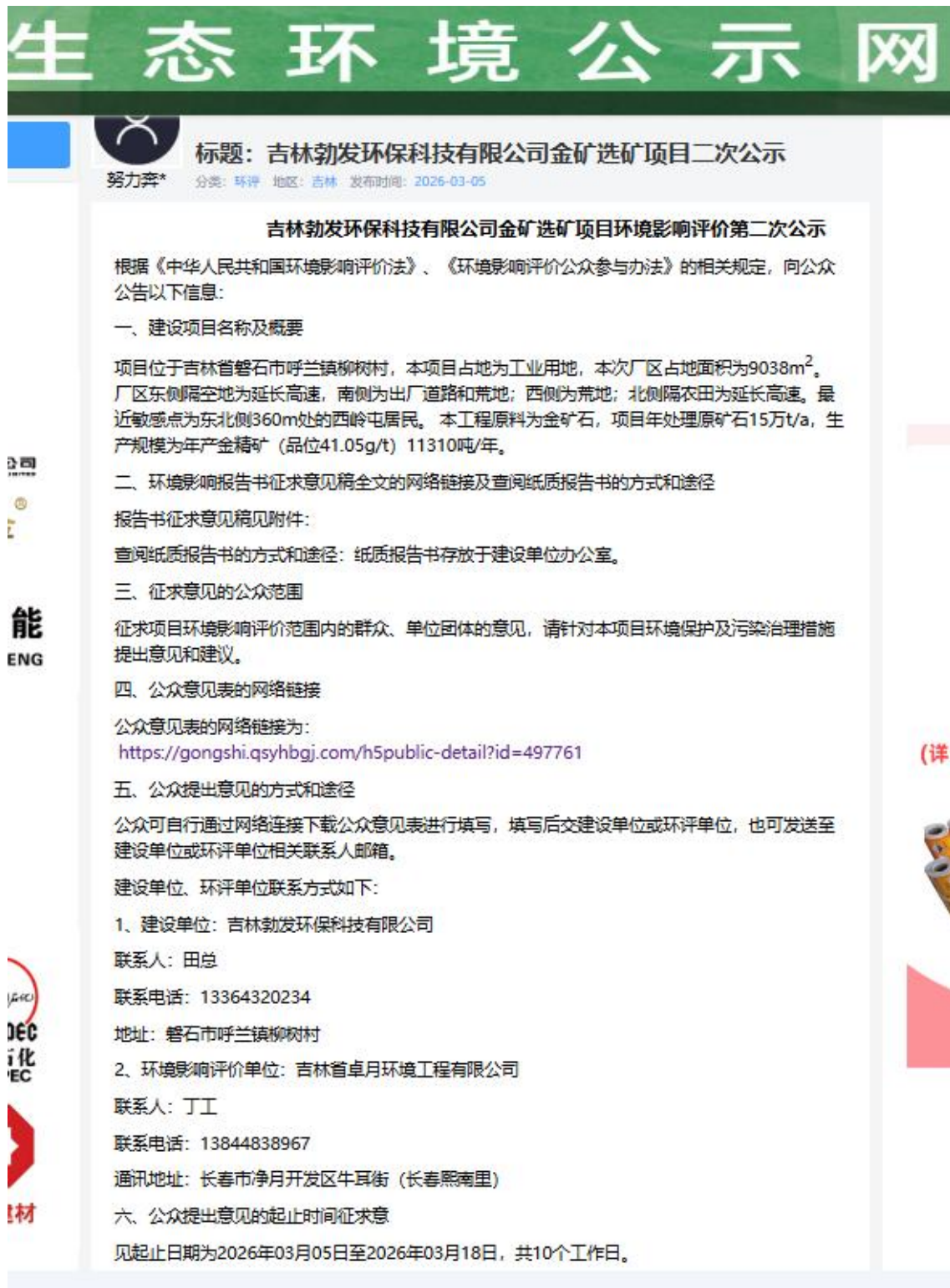
图 2-2 网络公示页面截图