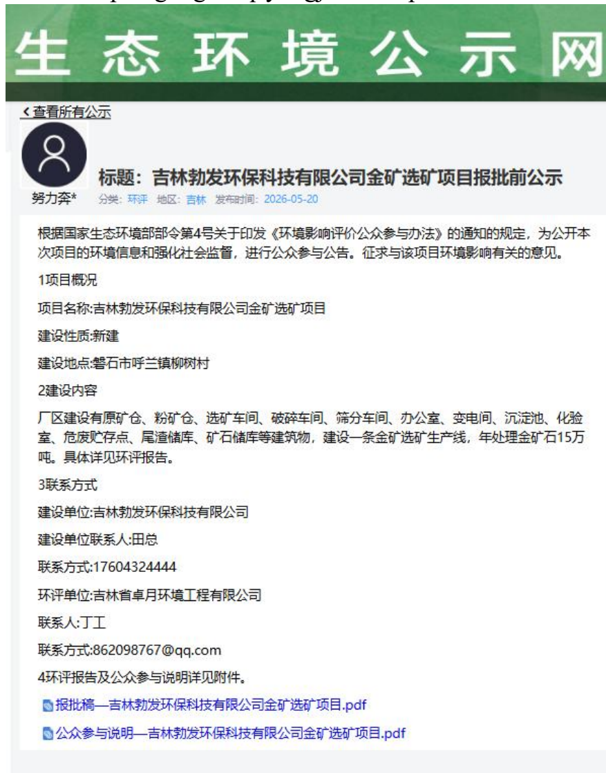
图 2-6 报批前公示截图

公示网址： https://gongshi.qsyhbgi.com/h5public-detail?id=518434