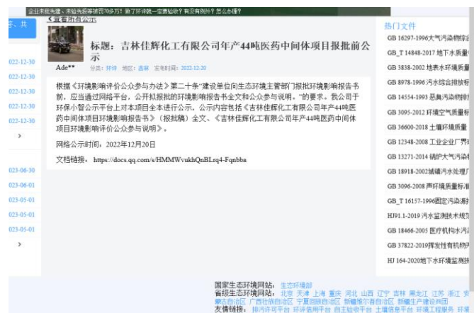
图 6.2-1 网站公示