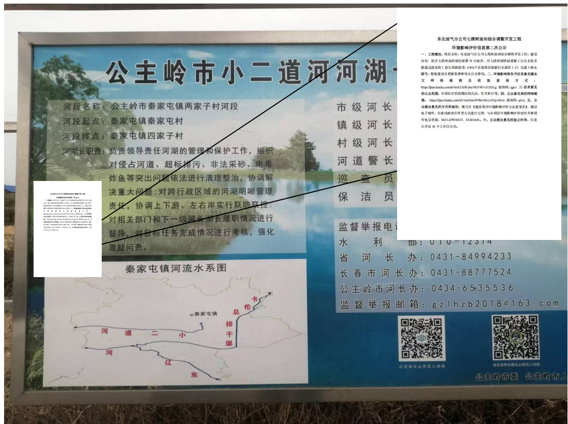
图 3.2-4 现场公示