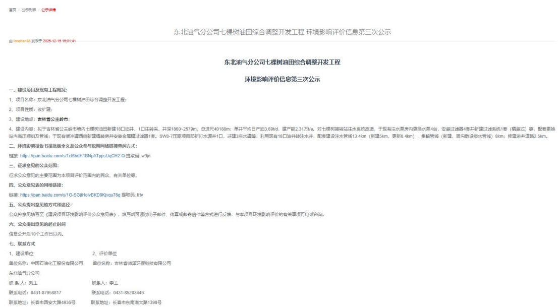
图 6.2-1 报批稿网络信息公示截图

环境影响报告书和公众参与说明公示，采用网络公开方式，公示地址为： http://www.huanpingbao.cn/ ，见下图：