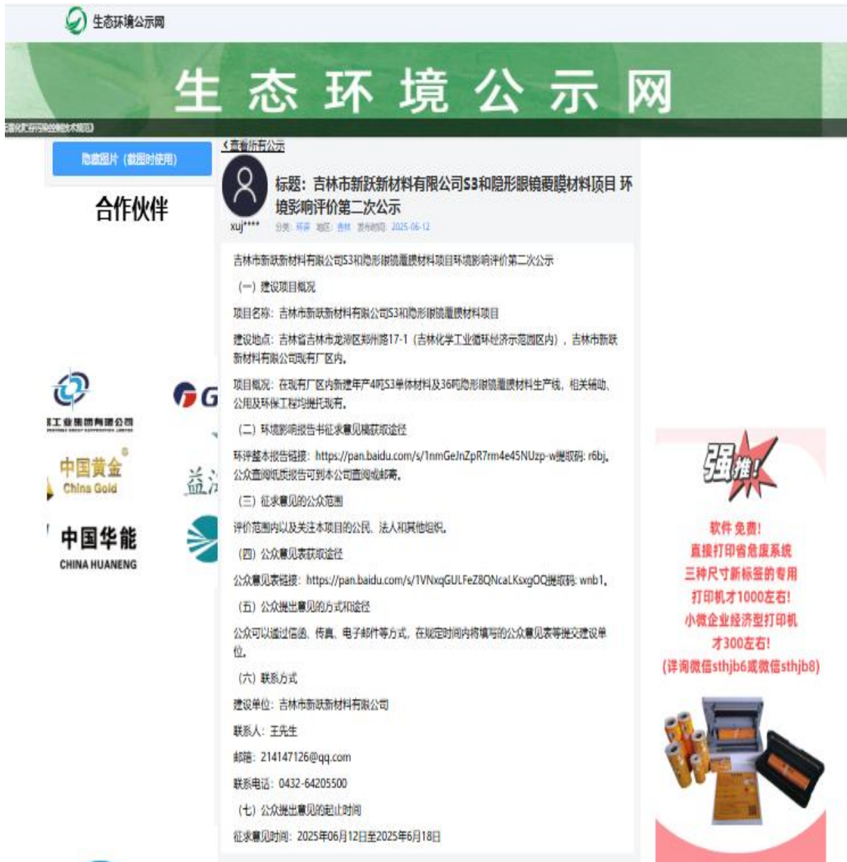
图 1 网络公示截图