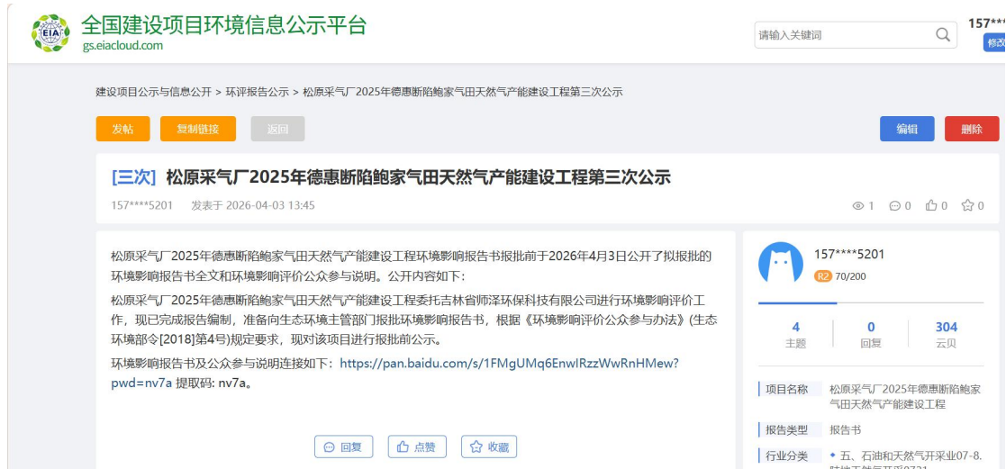
图 6.2-1 网站公示