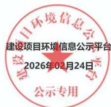
图 2-1 首次公示（网站）