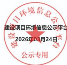
图 3-1 环评报告书征求意见第二次公示（网站）