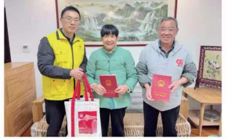
广东省自然资源厅工作人员在春节期间坚守岗位,用心惠民生。