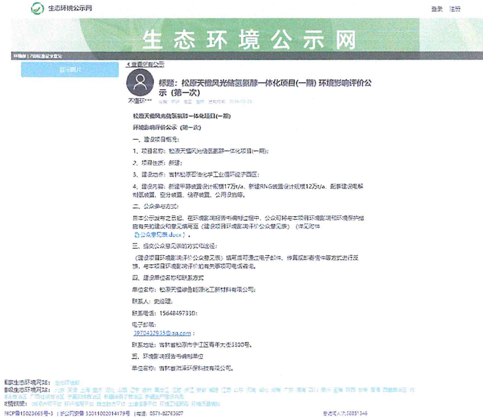
图 2.2-1 一次公示截图